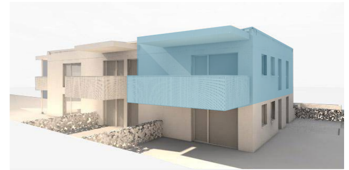
lage im gebäude